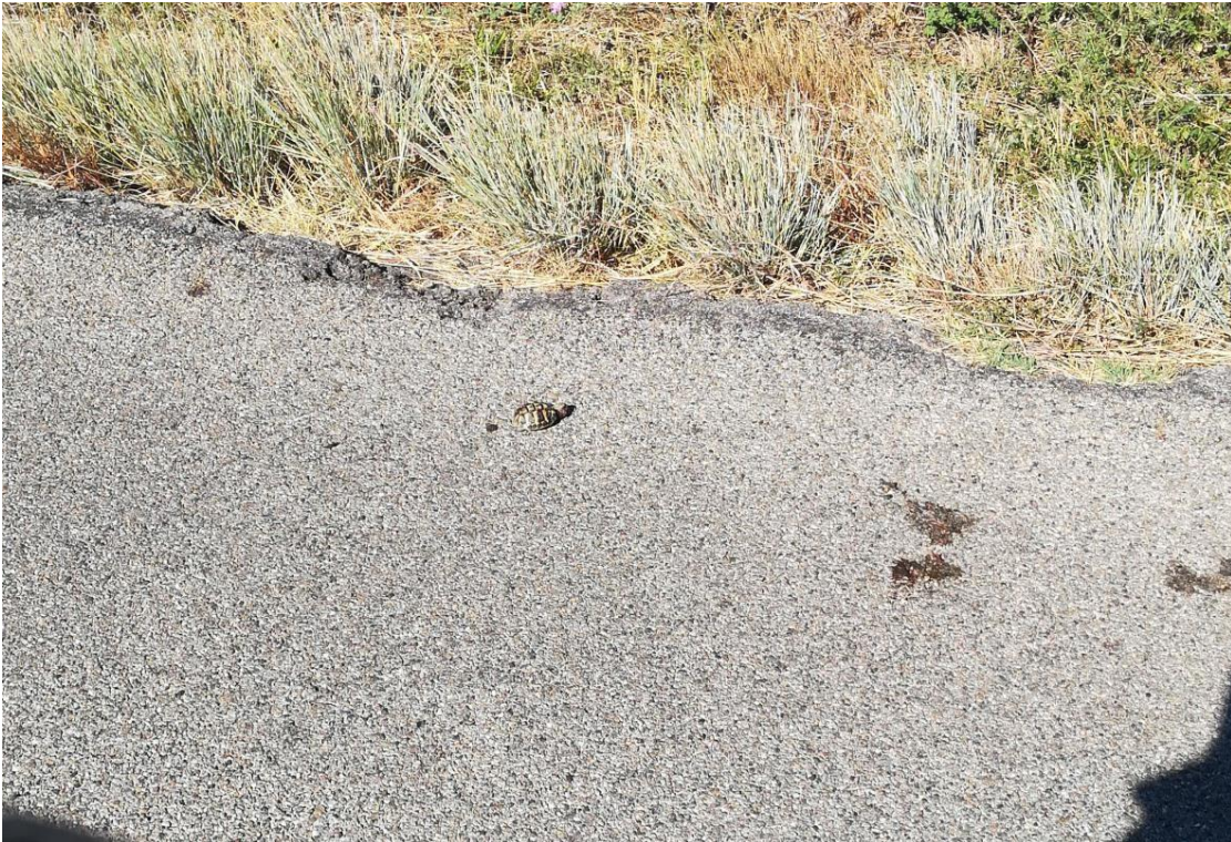
Atropellament. Estiu 2020.