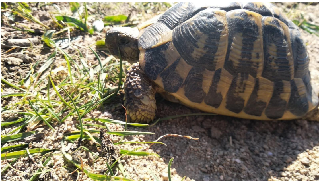
Tortuga rescatada del tram construït inexistent abans (abril 2021)

L'obertura d'un vial inexistent abans en una zona boscosa ha comportat una afectació evident (i contrastada) i una disminució a l'habitat de la Tortuga Mediterrània. Una cosa és pavimentar un camí públic preexistent, una via ja rodada, com es tenia previst, i l'altre obrir una via inexistent abans en una zona boscosa com es va fer sense cap protocol. L'alarmant disminució de poblacions ha provocat que Testudo hermanni estigui inclosa en el Conveni de Washington (apèndix II), annex C-1 de la directiva d'espècies protegides de la UE, espècie estrictament protegida segons el Conveni de Berna, espècie protegida pel govern espanyol (BOE de 1973) i espècie protegida segons la Generalitat de Catalunya (DOGC de 1985).