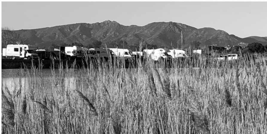
Les autocaravanes instal·lades (foto des de la platja, amb el riu per enmig)