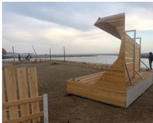
Construcció de bar i terrassa amb escenari a la vora del Fluvià

Juliol 2023, Grup en Defensa de la Gola del Fluvià