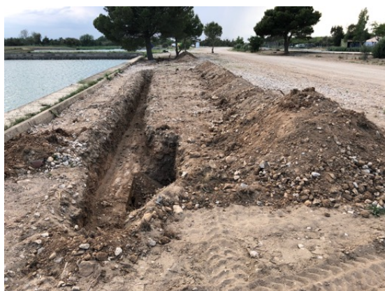
Moviment de terres i obres sense autorització