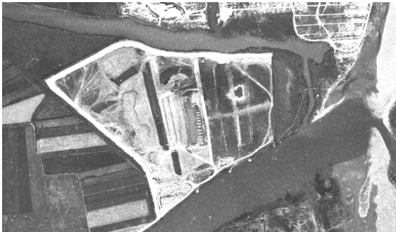
Fotograma vol d'agost de 1977, (ICC)

Documentalment, es pot acreditar el caràcter de públic del camí, al menys des de 1977, en base a les fotografies aèries següents: