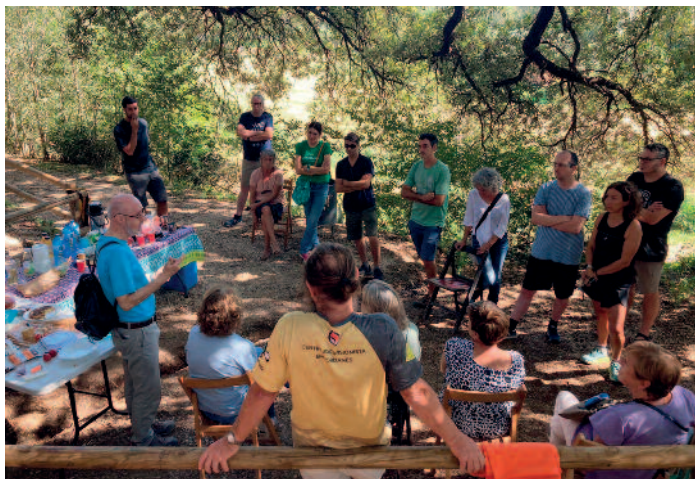
Trobada del diumenge 1 d'octubre a l'alzina de Can Massanet (Vilafant).

Però el que considerem encara més important és que, des de l'administració, se segueix un model obsolet, donant encara més espai al cotxe i trinxant el territori. En el marc de la crisi climàtica en el qual ens trobem, ens sembla que és un gran error no avançar cap a un canvi de la mobilitat i cap a un escenari cada cop més proper al de zero emissions. I encara més a Vilafant, un poble que ha quedat envoltat d'infraestructures i on aquesta carretera no és gens necessària. Allà, on hi ha l'únic pulmó verd que li queda al poble, el volen destruir per posar-hi una variant.