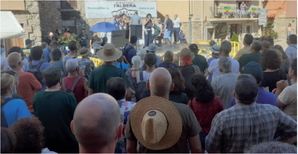
Un moment de la concentració de Capmany (05-09-21)

Durant els darreres mesos, sembla que la transició energètica s'ha començat a canalitzar i s'han anat recollint les demandes que fèiem des d'aquesta entitat al Departament d'Acció Climàtica, Alimentació i Agenda Rural (DACAAR). Aquestes demandes s'han plasmat parcialment en l'aprovació per govern del Decret Llei 24/2021, on, entre altres qüestions, s'ha recollit la necessitat de "protegir" els connectors ecològics, potenciar les instal·lacions petites i mitjanes (de fins a 5MW) i plantejar una planificació territorial per determinar com es fa la transició energètica en cada comarca. També s'ha plasmat dins el full de ruta del Govern la redacció de la Llei de transició energètica i la creació d'una empresa pública d'energia, encarregada de promocionar aquells projectes que per les grans empreses i inversors no són atractius, com instal·lacions en mitjaneres, en zones abandonades, etc.