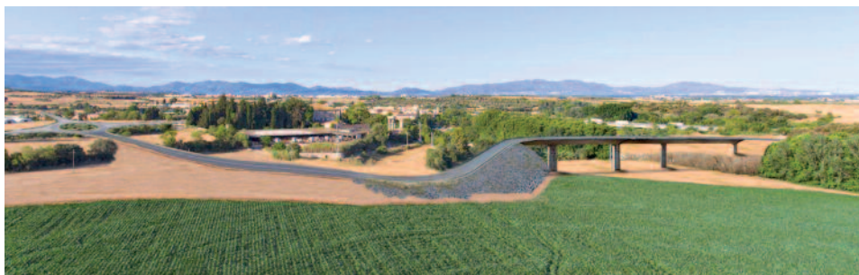
Fotomuntatge del pont en projecte. (Plataforma “No a la variant de Vilafant”)

Aquests darrers mesos d'estiu i tardor s'ha iniciat una campanya liderada per la plataforma local “No a la Variant de Vilafant” i els Amics del Manol amb l'objectiu d'aturar una carretera impulsada novament per la Diputació de Girona. El projecte consisteix a construir una variant a la carretera GIP-5129 entre Vilafant i Borrassà passant per sota els camps de Can Massanet i travessant el Manol amb un pont de 120 metres de longitud, 9,30 metres d'ample i 10 metres d'alçada. També implica uns talusos de 6 metres d'alçada.