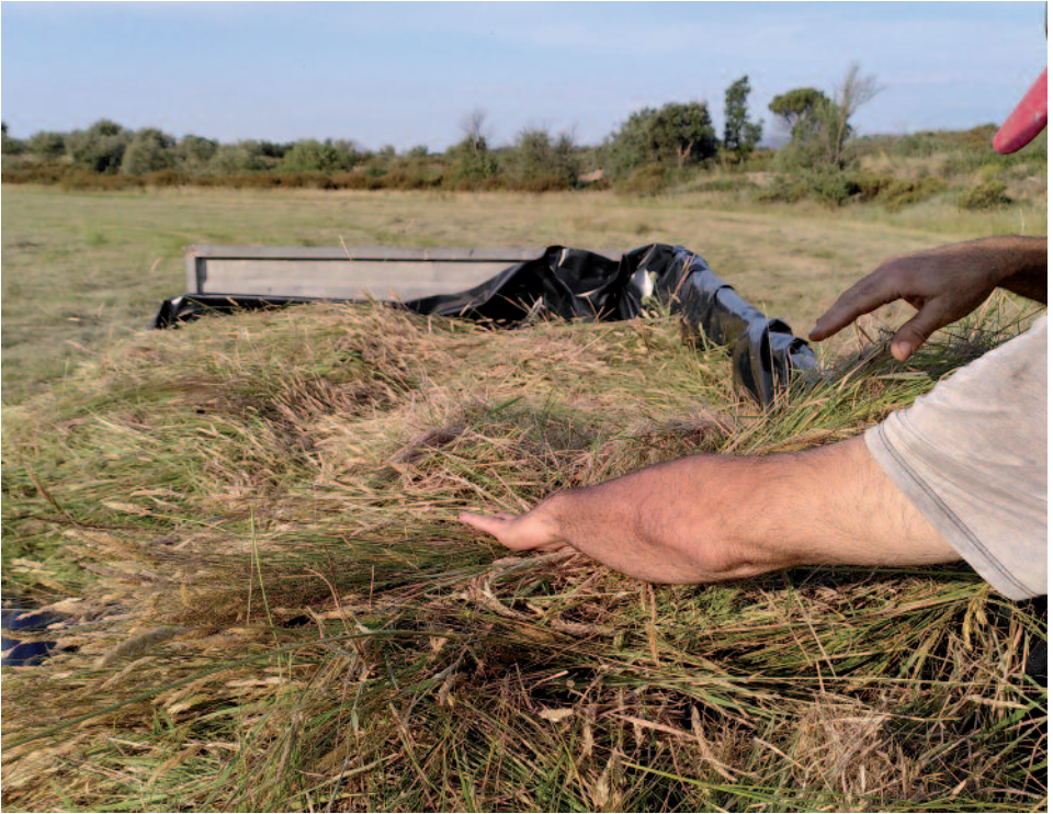
L'herba dallada de l'estany Garriga, un dels prats donador de grana.

Pel que fa a la recuperació de l'hàbitat en si, aquest any hem centrat l'esforç en la millora florística. El 2019, també amb ajut de la Diputació de Girona, ja es van tallar els freixes que havien anat ocupant el Prat Llarg en ser abandonat. Els rebrots d'aquest arbre s'han pogut anar controlant mitjançant el dall anual els anys següents, de manera que el terreny estava preparat per a l'acció de ressebra aquest 2021. Per poder realitzar la ressebra, hem hagut d'obtenir llavor. Això ho hem fet realitzant un dall específic amb aquest objectiu en diverses parcel·les de prats en bon estat de conservació. Un cop batut i garbellat, s'han obtingut el gra que servirà per aplicar al prat receptor en una jornada de voluntariat prevista per al dia 18 de setembre (vegeu detalls al calendari d'activitats d'aquest butlletí) . Amb això esperem enriquir la composició florística del Prat Llarg, recuperant les espècies perdudes més característiques de l'hàbitat original que haurien desaparegut en el seu abandonament. Els resultats els veurem la primavera vinent.