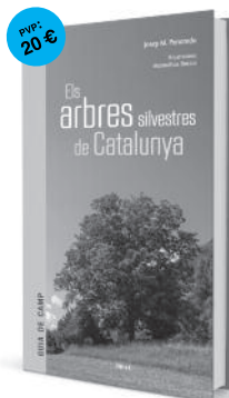
volum 2 Els arbres silvestres de Catalunya