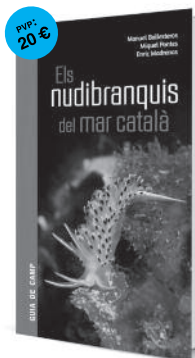
volum 3 Els nudibrànquis del mar català