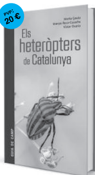
volum 1 Els heteròpters de Catalunya

Crancs de riu, nàiades, efímeres, frigànies, escarabats... Amb aquesta guia serem capaços d'identificar-los i coneixerem el seu paper com a bioindicadors de la qualitat del medi.