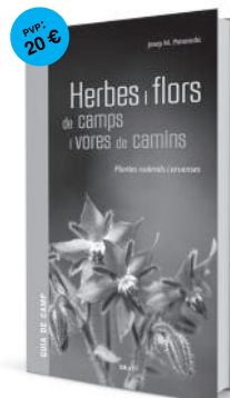
volum 4 Herbes i flors de camps i vores de camins