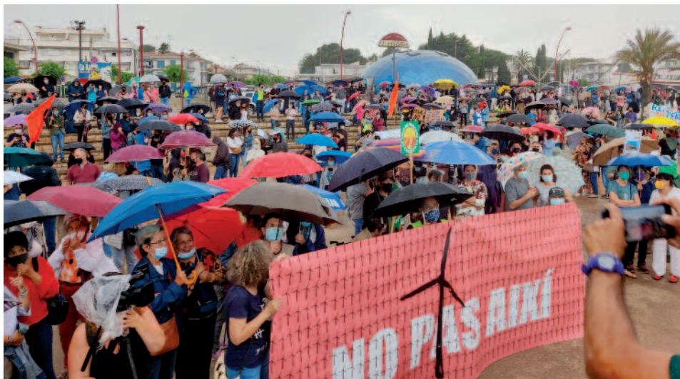
Concentració a l'Escala el 29 de maig