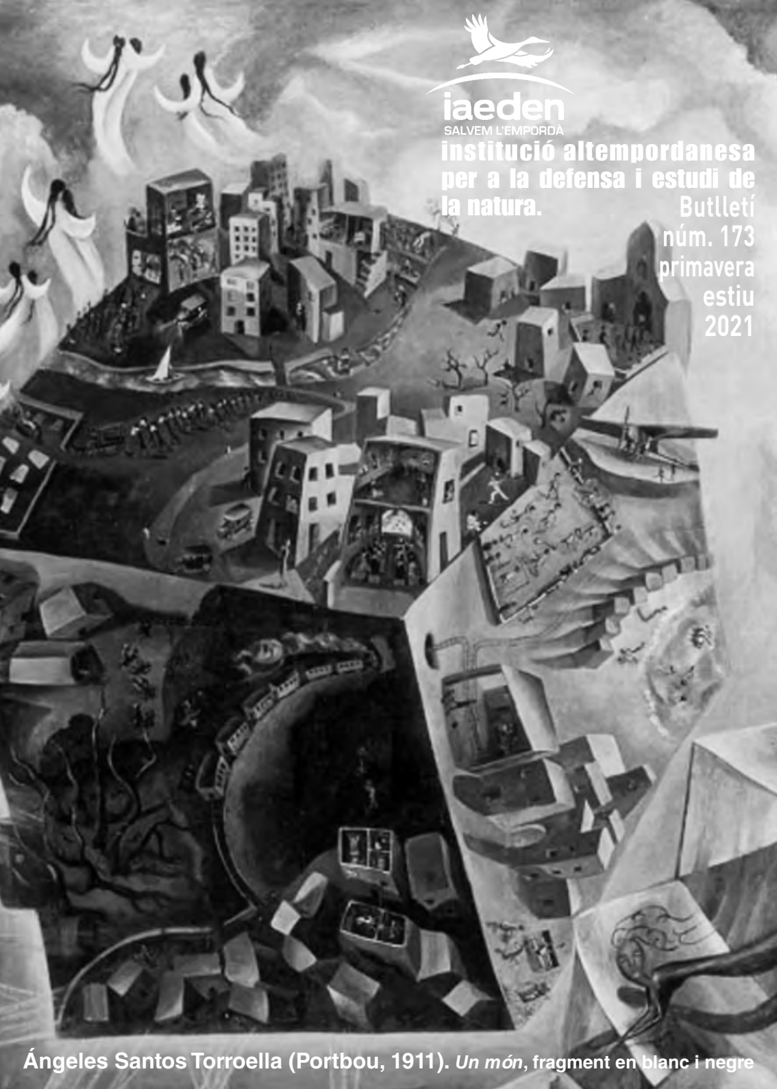
Ángeles Santos Torroella (Portbou, 1911). Un món , fragment en blanc i negre