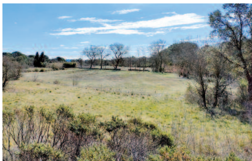
El prat Llarg o estany Garriga, ben sec el dia de la visita