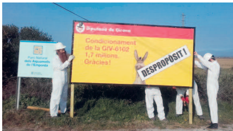
Acció realitzada per la IAEDEN-Salvem l'Empordà el 8 de febrer de 2019.

L'adjudicació es va realitzar a l'empresa Rubau-Tarrés que cobrarà 1,7 milions d'euros per la rehabilitació d'una carretera que ningú demana. És una injustícia ambiental.