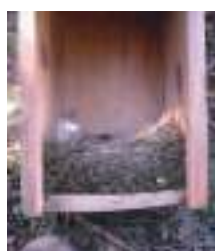
Neteja de les restes de cria de la temporada pasada en una caixa de mallerenga instal·lada l'any passat a l'horta ecològica del Mas Galceran (Sant Miquel de Fluvià).