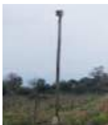
Caixa niu de xoriguer a Can Torres de Vilartolí.