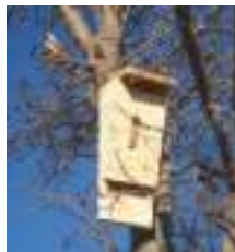
Caixa dormidor de ratpenat a l'horta ecològica la Vessana (Castelló d'Empúries).