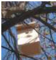
Caixa niu de mallerenga instal·lada a les vinyes del celler la Vinyeta (Mollet de Peralada).