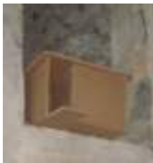
Caixa niu d'òliba instal·lada en un cobert de l'horta ecològica del Mas Galceran (Sant Miquel de Fluvià).