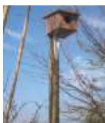
Caixa niu de xoriguer a l'horta ecològica la Vessana (Castelló d'Empúries).