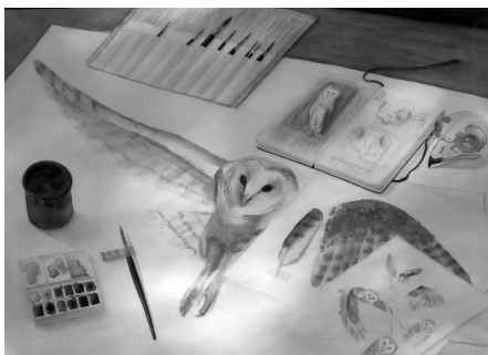
Categoria B Obra: El dibuix del concurs dels Aiguamolls de TURA SANS SANGLAS