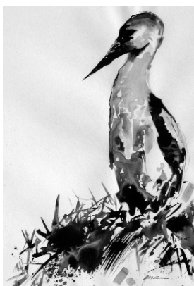
Categoria C - Obra: Niu d'ALBERT GIMÉNEZ TORRENT