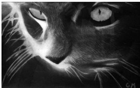
Categoria A - Obra: Night Vision de GENÍS MORA CASADO