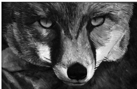
Categoria B - Obra: La mirada de la guineu de MIREIA CATALÀ BARRASETAS