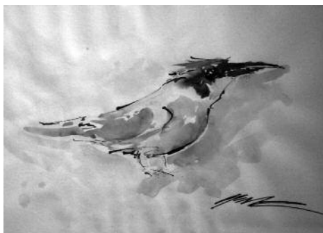
Categoria C - Obra: L'abellerol d'ALBERT GIMÉNEZ TORRENT