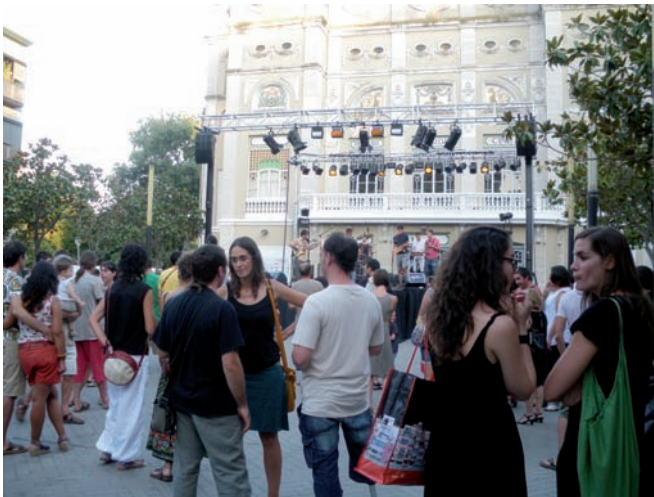
Moment del concert organitzat per INKIETA i VENDAVAL.