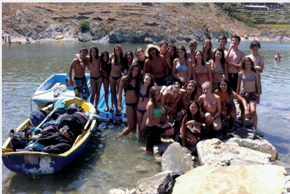
Els i les participants a l'illa de Portlligat, a punt per creuar a terra ferma.

A més, hem gaudit d'un entorn inigualable instal·lats al Mas Caials, a Cadaqués, i fent excursions a diversos punts del Parc Natural de Cap de Creus i també de l'Albera, així com fent un munt d'activitats d'educació ambiental i del lleure. Durant aquests dies, també hem tingut la sort de comptar amb la col·laboració de